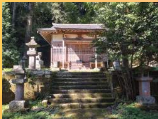
健武山湯泉神社（那須町大字芦野）