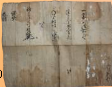
白川晴綱書状（当館寄託）